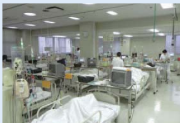
人工透析センター

臨床研修医指定病院(協力型)、 救急告示病院、 へき地医療拠点病院、 居宅介護支援事業所、 在宅介護支援センター、 NST 稼働病院、 病院機能評価認定 (Ver. 6)