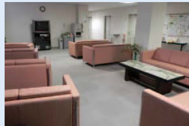
健康管理センター